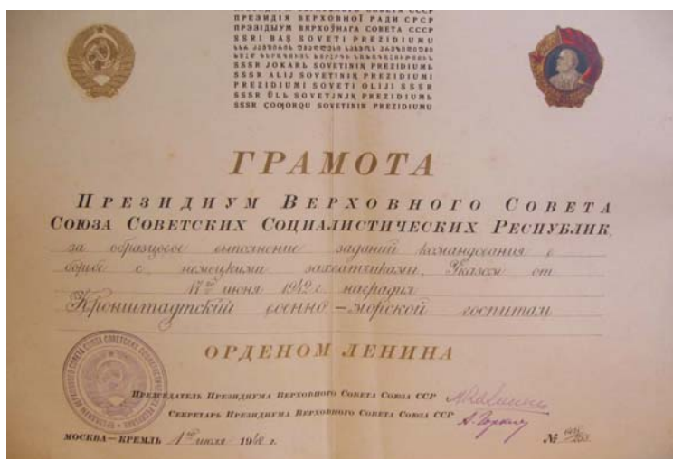
Грамота о награждении Кронштадтского Военно-морского госпиталя ОРДЕНОМ ЛЕНИНА

Указом Президиума Верховного Совета СССР от 17 июня 1942 г. Кронштадтский Военно-морской госпиталь награжден высшей наградой Родины — орденом Ленина. За образцовое выполнение заданий командования на фронте борьбы с немецко-фашистскими захватчиками и проявленную при этом доблесть и мужество, большая группа военнослужащих, рабочих и служащих получила государственные награды.