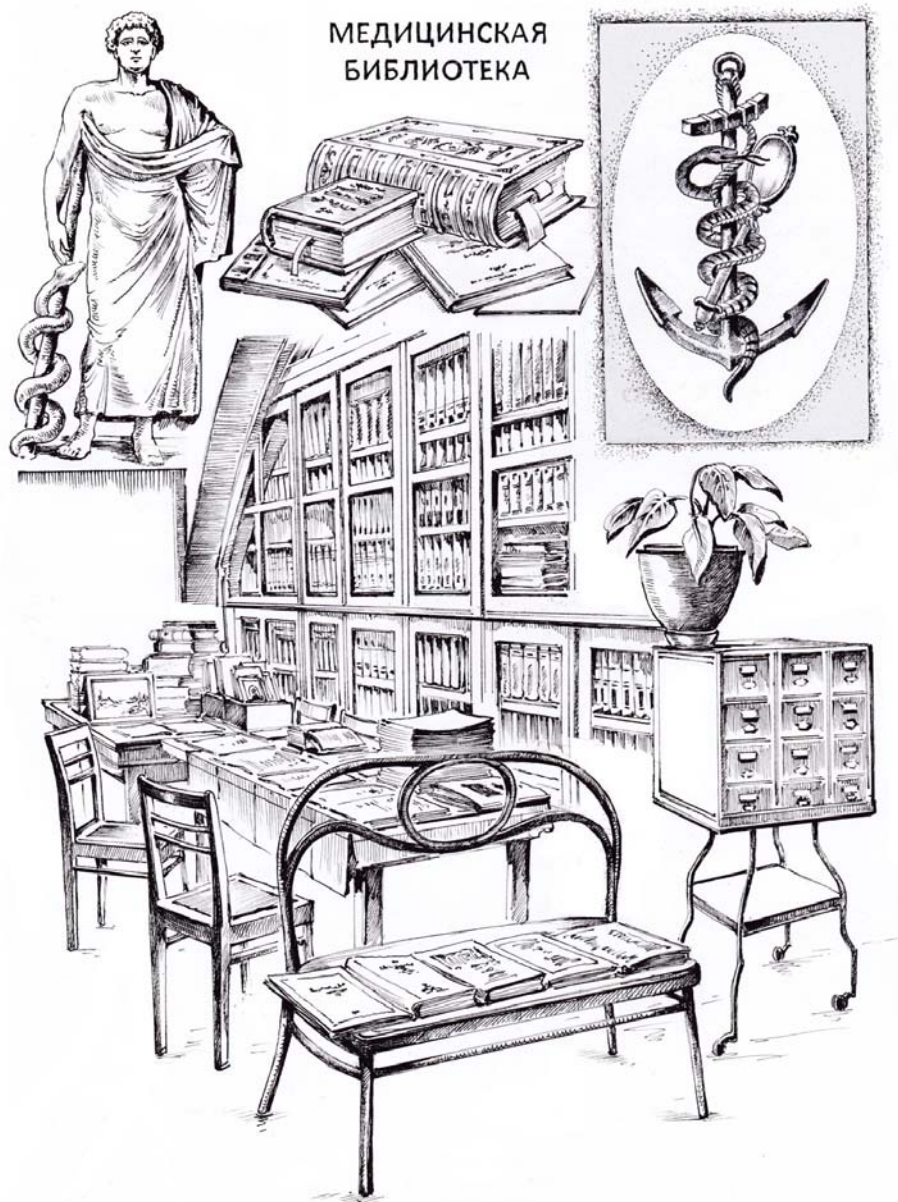
Хейлик О. Медицинская библиотека. Бумага, тушь. 2016. 20×30